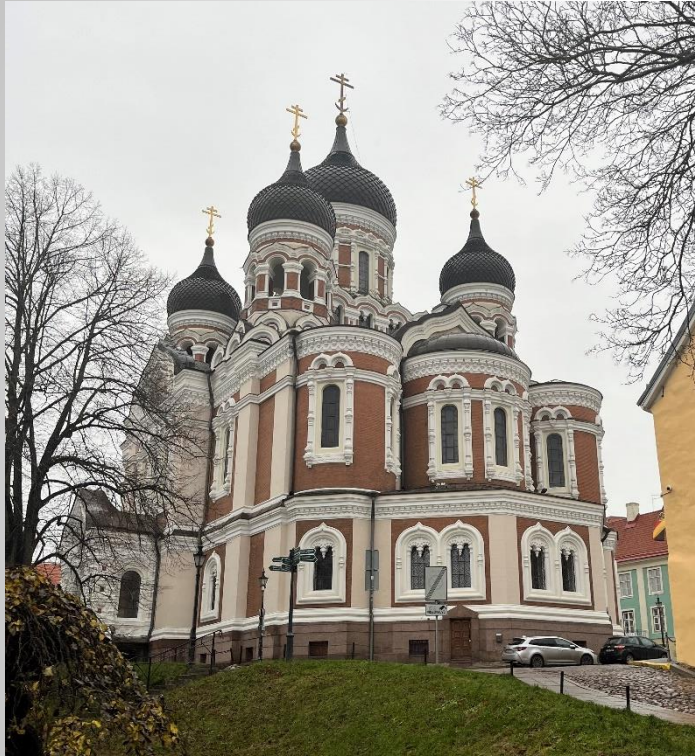
pravoslavna stolnica Aleksandra Nevskega