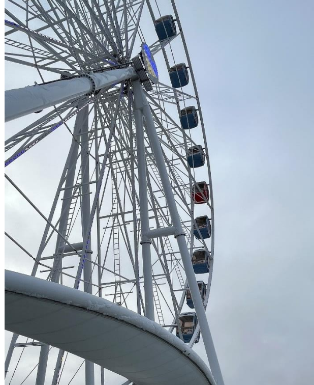
Skywheel of Tallinn