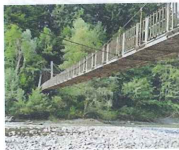
Most z brvjo

Sora meji Reteče in vas Suha na drugi strani brega