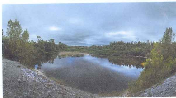
Gramozna jama v Retečah

Jama je priljubljena točka sploh za starejše ljudi, saj ni daleč in do nje vodi lepa sprehajalna pot. V vodi živijo mnogo katere živalske vrste med njimi tudi račke in labodi.