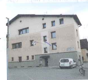
OŠ Cvetka Golarja

To šolo obiskujejo otroci iz Reteč in sosednjih vasi Godešič in Senica. Obiskuje jo okoli 100 učencev.