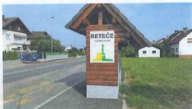
Cesta Škofja Loka- Ljubljana

Čez vas sta speljani 2 pomembni prometnici: cesta (Ljubljana- Škofja Loka) in železnica (Ljubljana- Jesenice)