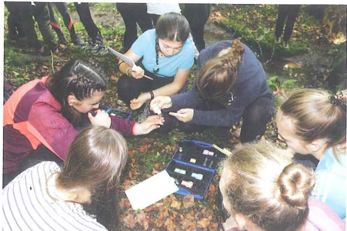
Dijaki so izvedli preproste analize vode s terenskim kovčkom – voda je neoporečna.

Na Biotehniškem centru Naklo v okviru programa Erasmus+ izvajamo med drugim tudi projekt Slavit. Projektna partnerja sta Zvezna gimnazija in zvezna realna gimnazija za Slovence iz Celovca in Licej Franceta Prešerna iz Trsta. V projekt so vključeni gimnazijci, traja dve leti in želi mladim približati večšine naravoslovja. Pogovorni jezik v projektu je slovenščina, saj so