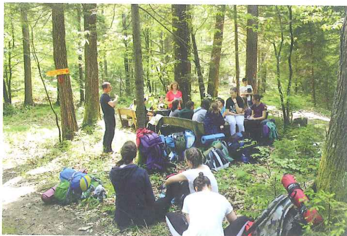
Kako izračunati prostornino vrtače in v kolikšnem času se napolni z vodo?

naši zamejci zelo zainteresirani krepiti tudi znanje in uporabo slovenščine. Vsaka šola gosti dijake dva tedna, kjer jim poskuša čim bolj plastično in učinkovito predstaviti naravo v najrazličnejših oblikah. Dijaki bivajo pri družinah, kar naj bi jih opogumilo tudi v tkanje bolj osebnih in prijateljskih vezi. Na BC Naklo smo gostili dijake obeh partnerskih šol od 7. do 19. maja 2018.