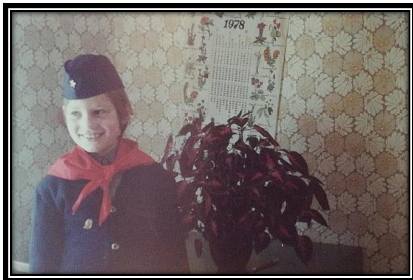
Slika 2: Jožev vnuk v uniformi Titovih pionirčkov

JOŽA: "Ja, seveda, bil sem vse to. Pobratenja v drugi jugoslovanski republiki se nisem udeležil. Tudi na mladinske delovne brigade nisem hodil zaradi tega, ker sem imel en mesec obvezne prakse v tovarni, potem pa sem imel še malo počitnic."