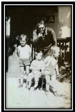
Slika 1: Stara mama in njeni otroci

JOŽA: "Ja, nekaj pa se še spomnim od tega. To so bila grozna leta. Da bi rekel, da je bil kdo od naših večja žrtev ravno ne, razen moj stric, ki so ga ubili, drugače pa nihče drug. Poznam pa tudi nekoga, ki so ga poslali na Goli otok in je to tudi preživel. Takrat so se dogajale grozne stvari."