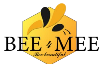
Slika 5: Postopni razvoj logotipa