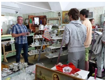
KrŠtacuna skriva veliko zanimivih izdelkov

Z intervjujem smo izvedeli veliko o delovanju neprofitne fundacije in trgovini z izdelki iz druge roke. Zanimiv je tudi potek rehabilitacije bivših odvisnikov, ki traja od 6-9 mesecev, celo morda nekaj več, saj je čisto odvisno od osebe, ki se prijavi v program. Spoznali smo, da iz odpadnih predmetov bivši odvisniki naredijo veliko uporabnih izdelkov, ki jih gredo potem v prodajajo. Na ta način nastane veliko manj odpadkov in uporabni predmeti lahko dobijo nov sijaj in nove lastnike. Nam se je celoten koncept zdel zelo zanimiv. Vabljeni, da jih obiščete v strem jedru Kranja.