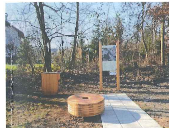
Slika 4: pot Jeprskega učitelja