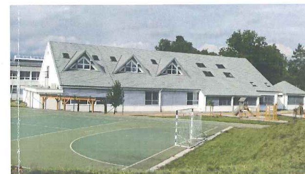
Slika 5: OŠ Orehek