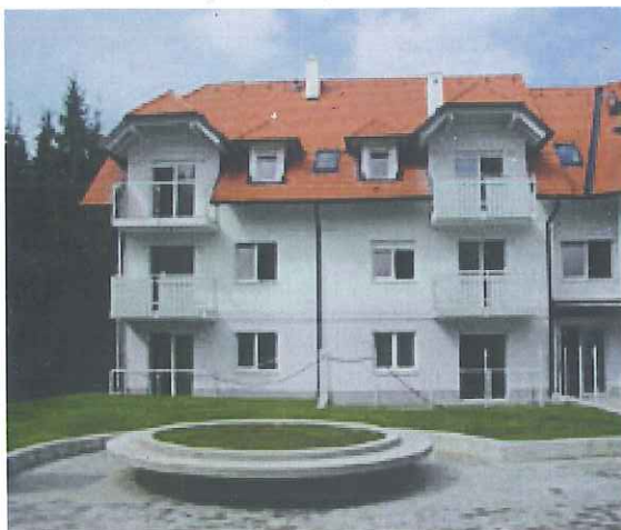
Slika 2: vrstne hiše v Drulovki