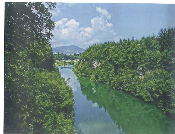
Slika 1: Sava ob Drulovki