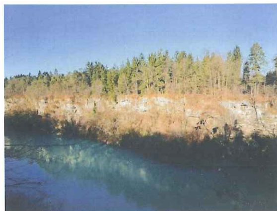
Slika 3: reka Sava