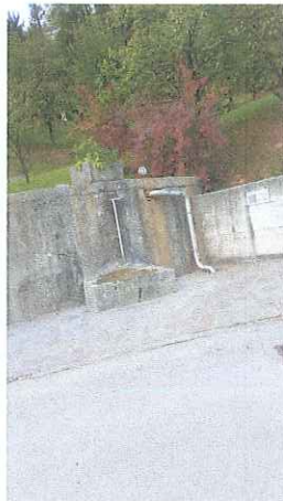
Izvir vode Kadunc

Dokaz da naj bi bilo to res nam dokazuje hribček sredi vasi na katerem je sedaj cerkev.