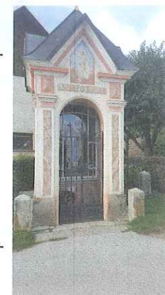
kapelica Lurške Matere Božje avtor: Manca Štular

V Strahinju je cerkev posvečena sv. Nikolaju, stoji na hribčku nad vasjo.