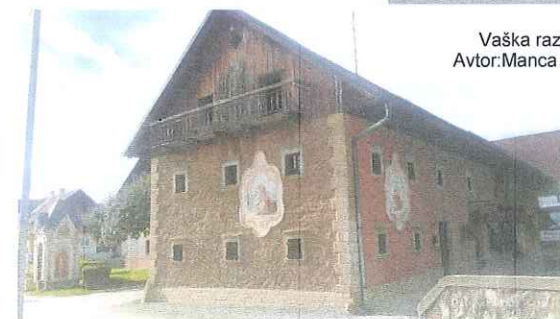
Janezovčeva hiša avtor: Manca Štular