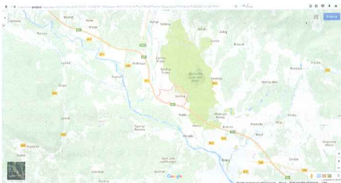
Zemljevid; kje smo