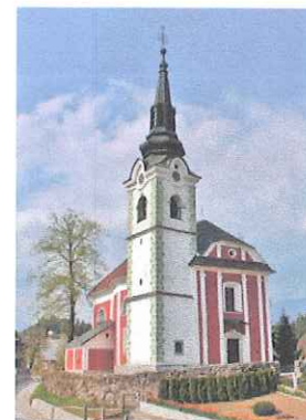
Cerkev sv. Nikolaja