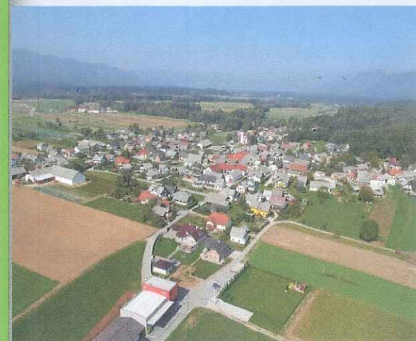
Pogled iz zraka na vas Strahinj http://naklo.si/galerija_slik/photos/naselje_strahinj.jpg (7. 10. 2016)