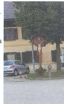
Vaška razpel Avtor: Manca Štular

V vasi pa stoji najstarejša kmečka hiša, ki ima na stropu vrezano letnico 1722 in je spomeniško varovana. Imenuje se »Janezovčeva hiša, ki ima na fasadi poslikave iz devetnajstega stoletja, ki predstavlja sv. Martina in sv. Florjana.