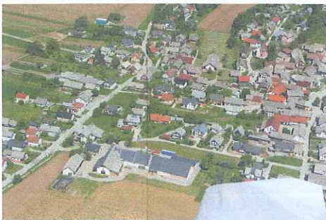
Avtor: Manca Štular

V vasi je veliko kmetij ki se ukvarjajo s poljedelstvom, v manjšini je živinoreja.