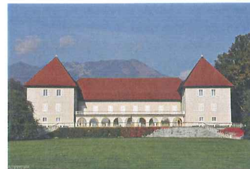
Dvorec Brdo

V neposredni bližini Kokrice se nahaja dvorec Brdo, ki je znan kot postojanka domačih in tujih politikov ter drugih pomembnih osebnosti.