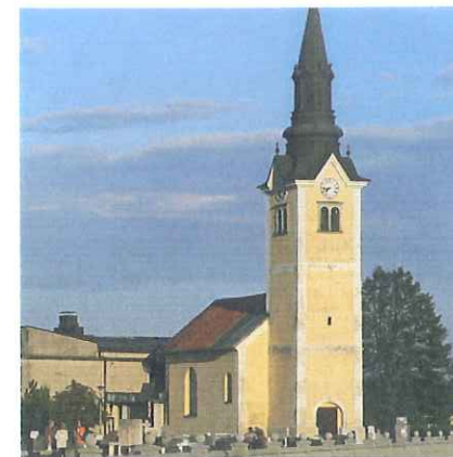
Cerkev Sv. Lovrenca na Kokrici

Ena izmed kulturnih značilnosti je Cerkev sv. Lovrenca, kjer so našli gotško navikulo (posoda, ki služi pri obredih) iz leta 1533.