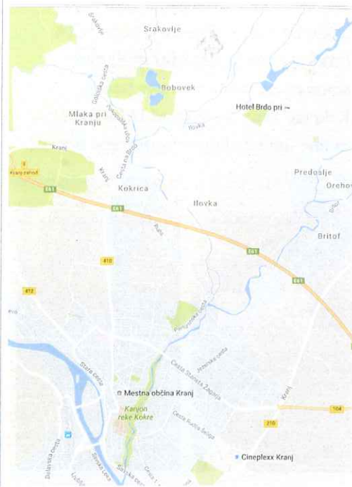
Zemljevid Kokrice in okolice

Kokrica je naselje, primerno za vsakogar, ki ima rad mir in bližino mesta. Prebivalci so med seboj tudi tesno povezani, na kar nakazujejo številni dogodki, ki se dogajajo čez leto. Združuje kar nekaj naravnih kot tudi kulturnih znamenitosti, zato je zanimiva ne samo za lokalne prebivalce temveč tudi za vsakega obiskovalca.