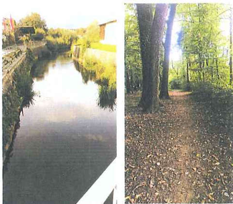
Potok Kokrica in Udin Boršt

Kokrica ima kar nekaj naravnih znamenitosti. Med njimi tudi reka oziroma potok Kokrica v katero se iztekajo mnogi okoliški studenci, sama pa se izteka v reko Kokro. Kokrico krasi tudi gozd Udin Boršt, ki ima danes vlogo krajinskega parka.