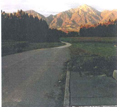
Pogled na Storžič z ene izmed peš poti na Kokrici

Naselje, ki leži ob reki Kokrici, na eni strani obdaja gozd Udin Boršt, na drugi pa gorenjska avtocesta Ljubljana–Jesenice.