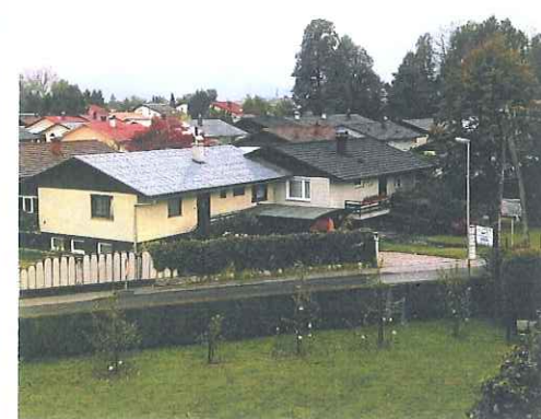
Pogled na naselje