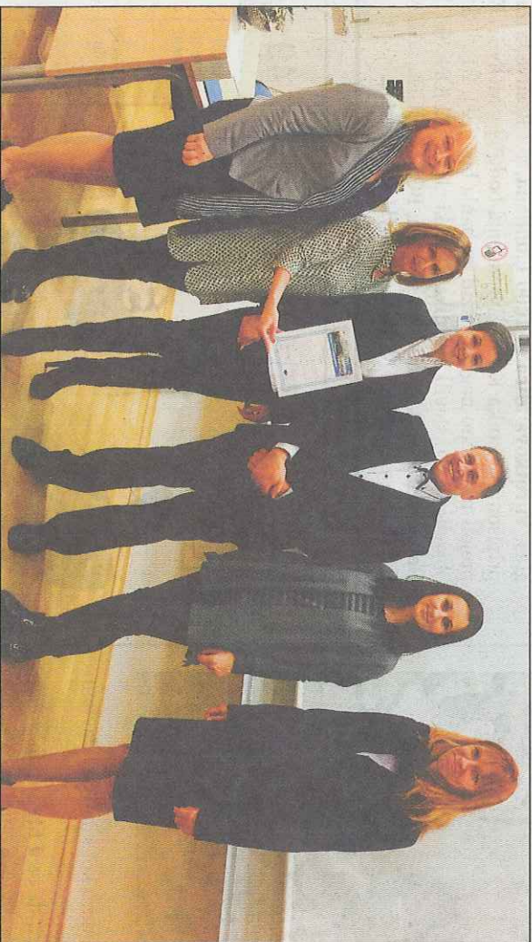
BC Naklo je prejel Erasmus+ listino kakovosti za mobilnosti v poklicnem izobraževanju in usposabljanju

Erasmus+ listina je tudi snova za nove kakovostne mobilnosti dijakov in učiteljev za obdobje do leta 2020. Z uspešno pridobitvijo projekta bodo leta 2020 lahko v tujino odšlo 70 učiteljev in 140 dijakov, ki se bodo na partnerskih srednjih šolah praktično izo-