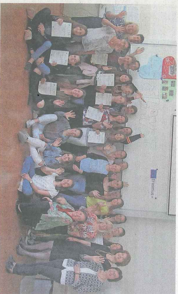
Udeleženci prve dijaške izmenjave v okviru projekta Slaviv skupaj z vodstvi šol in koordinatorkami projekta na sklepnem srečanju v Strahinju

Strahinj – Septembra lani so tri srednje šole s slovenskim učnim jezikom iz treh dežel oziroma držav – Državni znanstveni licej France Prešeren iz Bazovice pri Trstu, Zvezna gimnazija za Slovence v Celovcu in Srednja šole Biotehniškega centra iz Strahinja – začele uresničevati mednarodni projekt iz programa Erasmus+ z naslovom SLAVIT (Slovenija, Avstrija, Italija) z naslovom Slovensko naravoslovje treh dežel. Trajal bo do novembra leta 2019. Odločitev zanj je bila premissijena in tudi umejena z željami dijakov, učiteljev in mljilovih staršev po aktivni naravoslovni dejavnosti, po laboratorijskem in terenskem delu, po mednarodni dejavnosti, po povezovanju z matičnim narodom in po učenju in znanju slovensštine, ki so jih zapisali v posebni anketi. V projektu so vključene številne dejavnosti in raznoliki načini sodelovanja, glavne pa so dijaške izmenjave na temo naravoslovja, varovanja narave, trajnostnega razvoja in povezovalna teorije z delom v laboratoriju in v naravi.